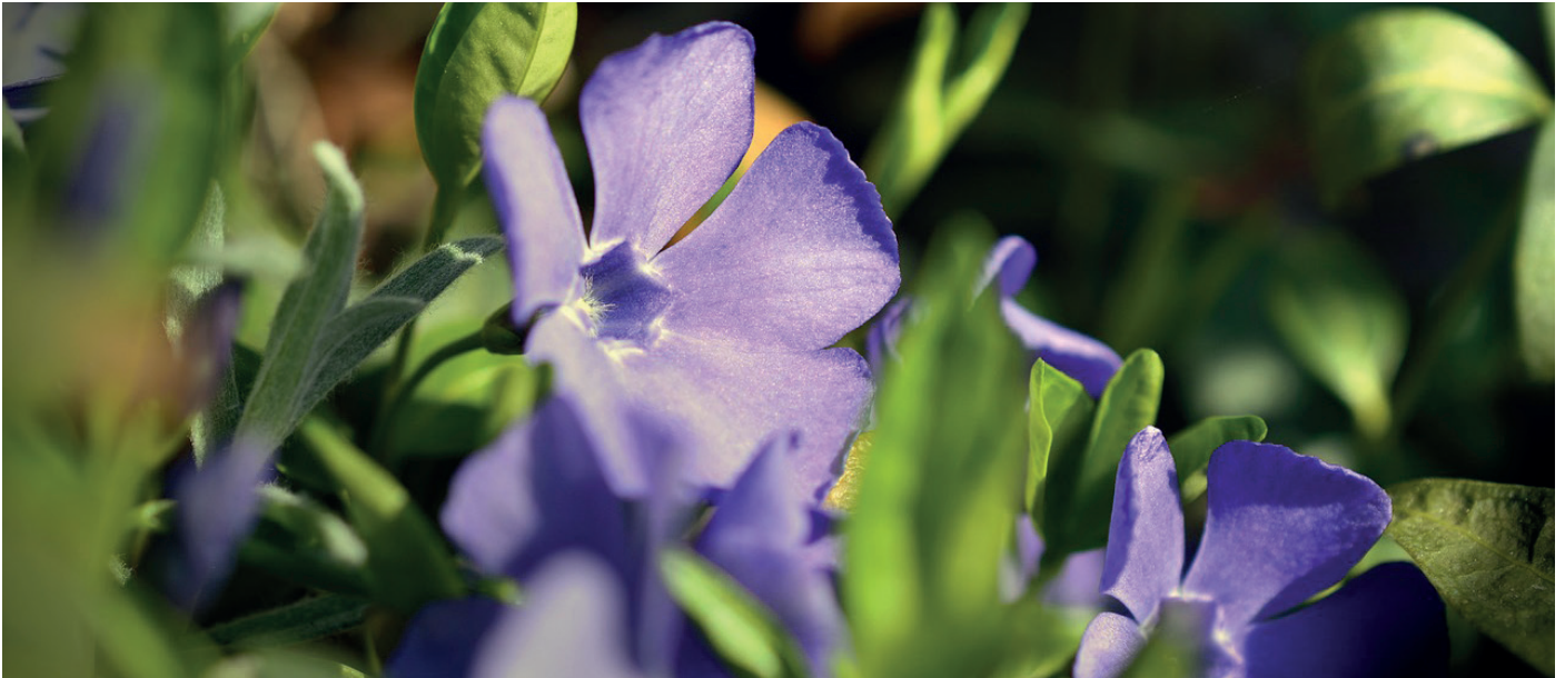
Immergrün (engl. Periwinkle)